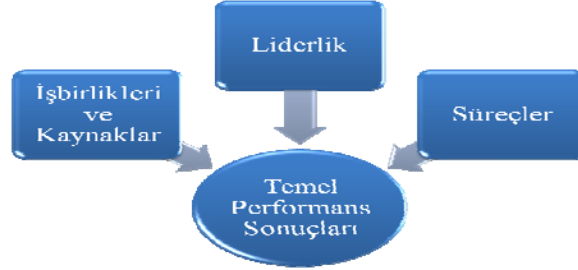
Şekil 2. Araştırmanın Teorik Modeli

Bu çalışmada, EFQM Mükemmellik Modeli temel alınarak oluşturulan teorik model (Şekil 2) kapsamında, plastik enjeksiyon kalıp tasarımı ve üretimi yapan “M” firmasında; liderlik, işbirlikleri ve kaynaklar ve süreç değişkenlerinin, işletmenin temel performans sonuçlarına olan etkisi araştırılmıştır. Araştırma kapsamında; liderlik, işbirlikleri ve kaynaklar ve süreçler bağımsız değişken, temel performans sonuçları ise bağımlı değişken olarak ifade edilmiştir.