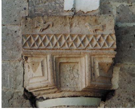
Şekil 4. Narteksin güney cephesinde yer alan sütun başlığı

Sütun başlıkları üzerinde melek, aslan ve haç figürleri bulunmaktadır. Galeri katının batı cephesine açılan penceresi üzerinde de aslan figürleri yer almaktadır. Bu pencere narteks eksenine yerleştirilmiştir. Narteks kapandıktan sonra sütunların arasına 4 adet ahşap doğrama pencere yerleştirilmiştir. Giriş kapısı da, ahşap doğramanın dışarıya bakan yüzüne çinko kaplanıp, üzerine çinko çivilerle formlar oluşturularak elde edilmiştir.