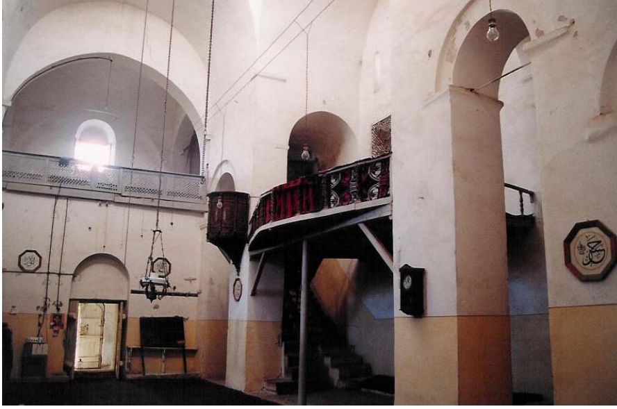
Şekil 3. Naostan galeri katı ve “Kadınlar Mahfili”ne bakış

Parekklesionun birinci katına çıkan merdivenden günümüze sadece son üç basamak ulaşabilmiştir. Naosdan galeriye çıkan merdivenden ulaşılan bir kapısı vardır. Bu bölümün boyutları yaklaşık 3x14 metredir. Döşemesi üç bölüm halindedir. Normal döşeme kotundan 41 cm. yüksekte olan kısım taş kaplamadır. Orta kısım rabita tahta kaplamadır ve konstrüksiyonu ahşaptır. Mekânın batı ucu ise yine taş kaplamadır. Örtü sistemi doğu batı yönünde beşik tonozdur.