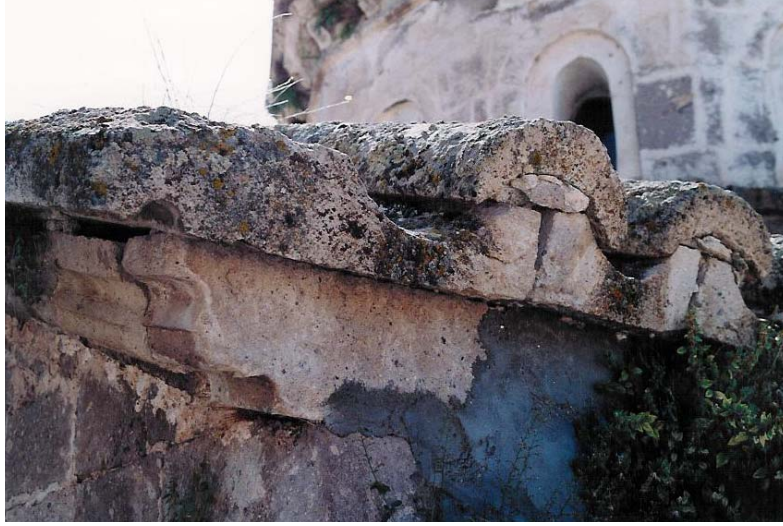
Şekil 5. Çatı kaplaması taş kiremitler