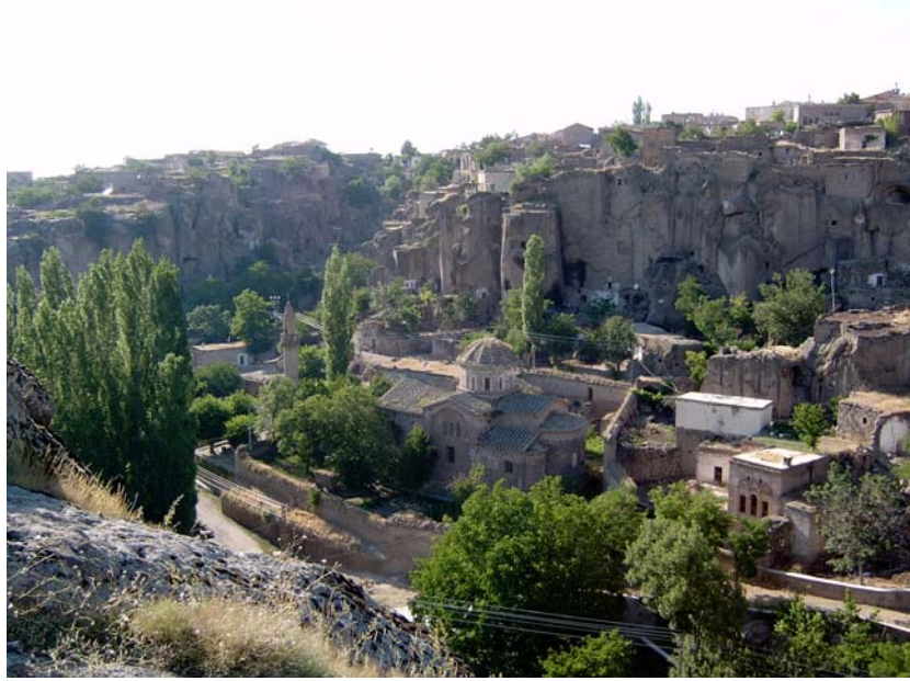
Şekil 1. Hagios Gregorios Theologos Kilisesi ve Aşağı Mahalle

Hagios Gregorios Theologos Kilisesi, Güzelyurt'un ilk yerleşim alanı olan Aşağı Mahalle'de yer alır † . Bölgede ilk olarak kilise çevresindeki kaya oyma mekânlara yerleşilmiştir. Mübadeleden önce Aşağı Mahalle'de Hıristiyanlar, Yukarı Mahalle'de ise Müslümanlar oturuyordu.