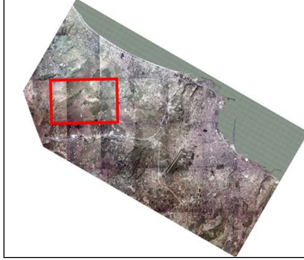
Şekil 1. Uygulama alanı

Uygulama alanı Samsun ili Atakum beldesinde, 11.6 km 2 kaplayan bir bölgedir. Karar verme problemi yeni toplu konut alanları için en uygun yerlerin belirlenmesini içermektedir. En uygun alanların belirlenmesinde jeolojik durum, toprak arazi kullanım kabiliyet sınıfları, eğim ve bakı kriterleri ele alınmıştır.