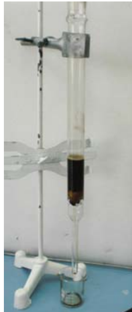
Şekil 2. Adsorpsiyon kolonu