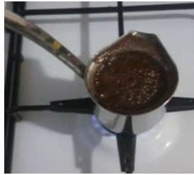
c) Türk kahvesi, cezve