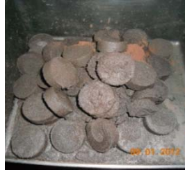
b) Espresso (Starbucks®)