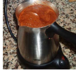
d) Türk kahvesi, makine