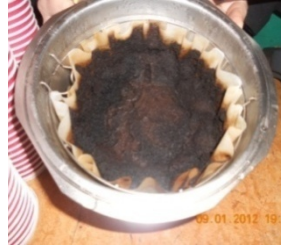
a) Filtre kahvesi (Starbucks®)

uygun olarak Şekil 2’de görülen 32 cm uzunluğunda ve 1.8 cm çapındaki kolona farklı miktarlarda serbest dolum şeklinde yüklenmiş ve 30 mL atık su ile muamele edilmiştir.