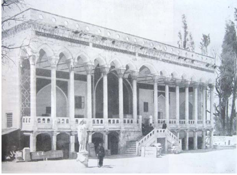
Şekil 2.2. Çinili Köşk'ün müzeye çevrildikten sonraki hali (Gurlitt, 1999).

konusunda halkı aydınlatma, yıllarca gerekli özenin gösterilmemesi sonucu Avrupalılarca yurtdışına götürülmüş tarihi mirasa sahip çıkma konularına da değinmiş, Avrupa'nın Osmanlılar'a saygı duymasını sağlama gerekliliğinden söz etmiştir. Avrupalıların ilerlemelerini, Osmanlı topraklarında yaşamış uygarlıklara ait eski eserler üzerinden inşa etmiş olduklarına dikkat çeken Maarif Nazırı konuşmasını, müzenin yerleşim alanı ve içindeki eserler arasındaki fiziksel bağlantıya dikkat çekerek bitirmiştir: